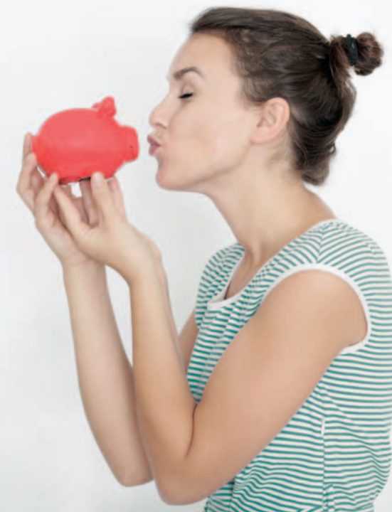
24.07.01 Titelbild: © Peter Atkins - Fotolia.com