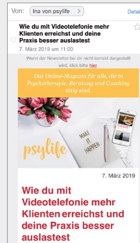
Beispiel für einen Standalone-Newsletter