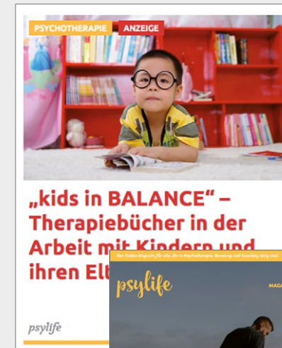
Beispiel für ein Advertorial