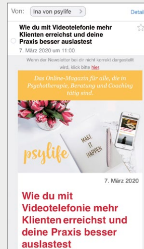
Beispiel für einen Standalone-Newsletter