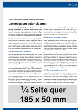
1/4 Seite quer im Innenteil (185 x 50 mm), 4c 280,- €