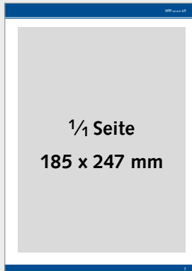
Ganze Seite im Innenteil (185 x 247 mm), 4c 980,- €